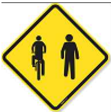
PLACA A-30c TRÂNSITO COMPARTILHADO POR CICLISTAS E PEDESTRES S/ESC.