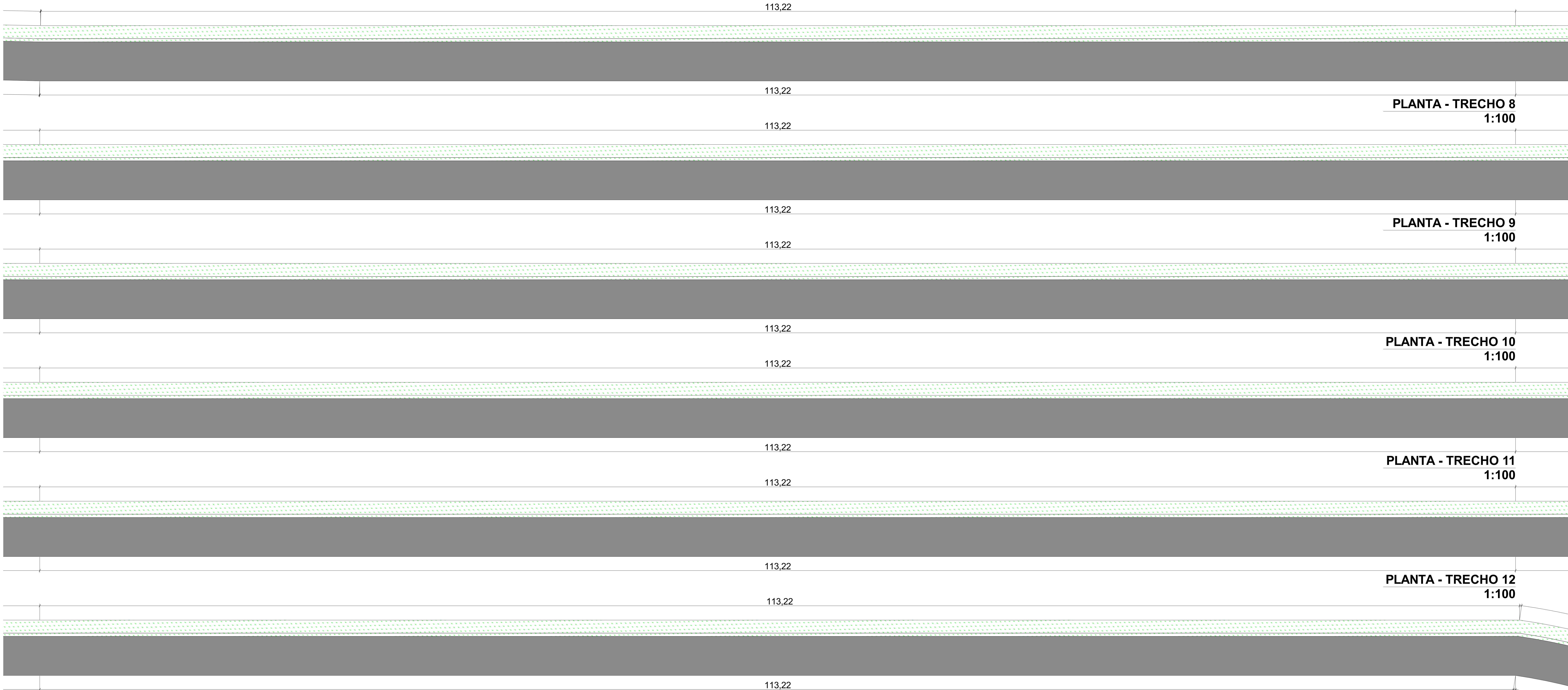
PLANTA - TRECHO 8 1:100