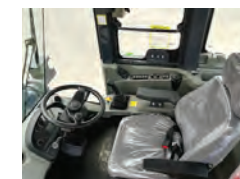
Coluna de direção com ajuste de altura e rebatimento. Assento ajustável com amortecimento bidirecional, apoio de braço e suspensão.