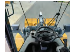
Cabine com ar-condicionado, ar quente e frio, ROPS/FOPS; Ótima visão para trabalho. Porta copo, extintor de incêndio e para-sol inclusos.