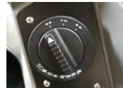
Seletor de faixas de trabalho com 3 modos de operação (econômico, normal e força total). Com economia de até 15% de combustível.