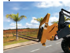
Garfo de carregamento de engate rápido.