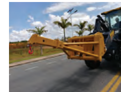
Braço de movimentação de materiais de engate rápido.